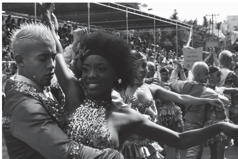
Figura 1. Bailarines caleños en el Salsódromo durante la Feria de Cali 2011.

una creación de la burguesía industrial norteamericana; bajo la influencia también de la pachanga newyorquina de los años 60 y el boogaloo. Un baile ensamblado desde la calle y la esquina de los barrios populares con recursos danzarios de distintas procedencias, y consagrado finalmente en los más importantes escenarios mundiales del espectáculo y la industria del entretenimiento del siglo XXI, propiciados por la globalización. No puede negarse que el Estilo Clásico Caleño es una genuina creación popular de por lo menos tres generaciones de bailarines de esta ciudad, a lo largo de medio siglo, así como no puede negarse que tal estilo remite a diversas épocas y estilos, puestos en circulación por la industria cultural transnacional, donde la articulación entre la radio, la industria discográfica y el cine se encuentran, en distintos momentos, con públicos urbanos de sectores subalternos que han producido ese nuevo lenguaje corporal. 19