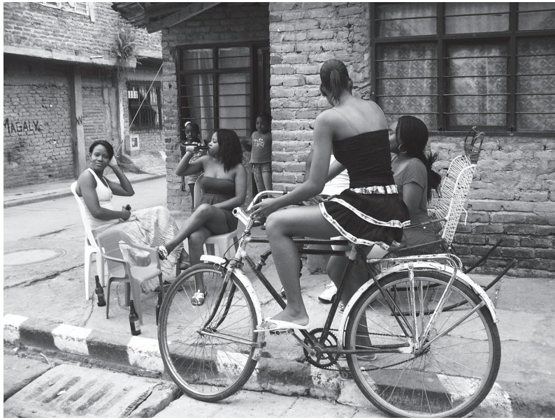
Figura 8. Las mujeres también ocupan la calle en sus momentos de esparcimiento cuando se vive una relación más flexible con el tiempo. Barrio el Vergel. Cali, 2013.

La relación con el tiempo ha sido estudiada por antropólogos e historiadores quienes se han referido a las distintas formas de vivirlo y representarlo por diversas culturas. Entre ellos Evans-Pritchard en su etnografía sobre Los Nuer (1940); Pierre Bourdieu quien analizó las actitudes acerca del tiempo, por parte de los campesinos kabileños de Argelia; y el historiador inglés E.P. Thompson (1989) en su capítulo sobre las percepciones del tiempo a partir del renacimiento, y los cambios en los modos de medirlo y representarlo durante la transición al capitalismo industrial. 29 En esta obra plantea cómo en algunas sociedades “primitivas” estudiadas, la relación entre el trabajo y el tiempo se da mediante la “Orientación por el quehacer”. Según Thompson, la orientación por tareas designa no sólo las faenas del trabajo regidas por los ciclos naturales, o determinadas actividades agropecuarias descritas por él, sino un tipo de representación y de relación con el tiempo distinta a la rigidez propia del capitalismo contemporáneo.