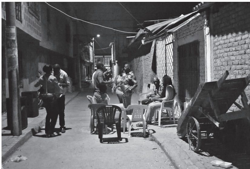
Figura 7. La carreta, herramienta de trabajo, hace parte de la escenografía en la ocupación de la calle por vecinos, familiares y amigos en su uso del tiempo. Distrito de Aguablanca, Cali, 2013.