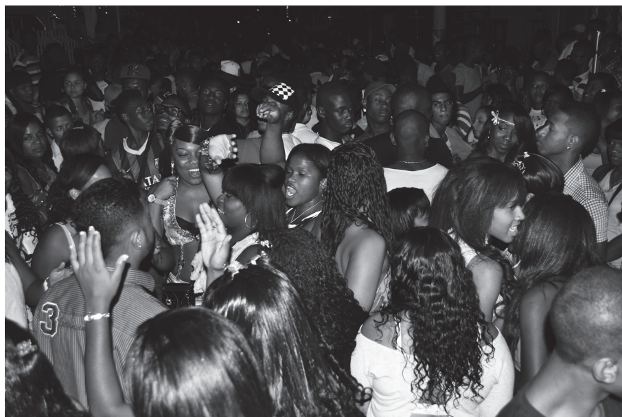
Figura 9. Jóvenes del Distrito de Aguablanca en una de las verbenas callejeras, donde la música y el baile es el vínculo que los convoca. Cali, 2013.

En conclusión, nuestra noción de cultura popular aquí expuesta es irreductible al folclor; está atravesada por los medios de comunicación y las nuevas tecnologías; es producida también industrialmente; está inserta en el mercado y mezclada con elementos de distinto origen; pero a su vez es el lugar de una diferencia indicada en los modos cómo los agentes sociales se relacionan con el tiempo y con el espacio, con el cuerpo y con el lenguaje. Y aunque podamos identificar un patrón socioeconómico relativamente común en los sectores populares, hay además un complejo de causalidades entrelazadas que determinarían los matices y las características específicas en ese entramado de relaciones.