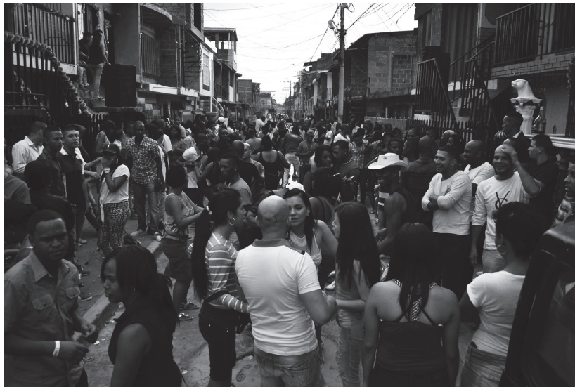
Figura 6. Vecinos del Distrito de Aguablanca durante una de tantas verbenas callejeras organizadas por la misma comunidad. Cali, 2013.

Es en el tiempo de ocio y en el espacio público donde se intercambian los lenguajes y se celebran las prácticas que hacen menos dura la supervivencia. Esta relación con el espacio es una de las características de la cultura popular como la estamos considerando, cuyos agentes sociales tienden a ocuparlo colectivamente, mientras las élites burguesas suelen recluirse en la privacidad de sus cómodas viviendas, (casas, fincas, apartamentos u oficinas). Pero los sectores populares «invaden» el espacio público de una manera extrovertida, escandalosa, cuando se trata de la fiesta, el carnaval o la protesta, o incluso en las labores de supervivencia cuando pregona sus servicios o vende desde la calle sus productos. 26