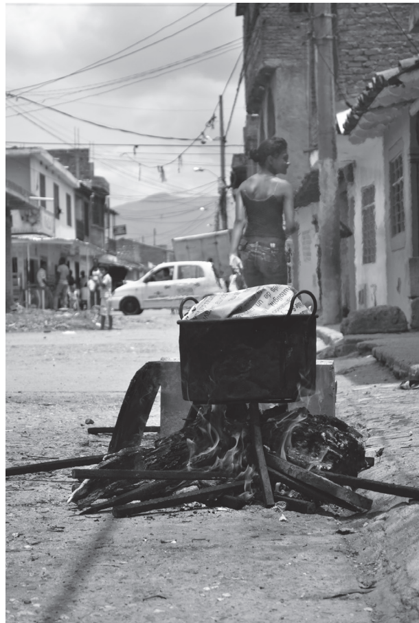
Figura 5. La calle también es un lugar apropiado para preparar la comida en un fogón de leña, al día siguiente de la fiesta, o los fines de semana, como una forma del “rebusque” para ganarse la vida. Cali, 2013.