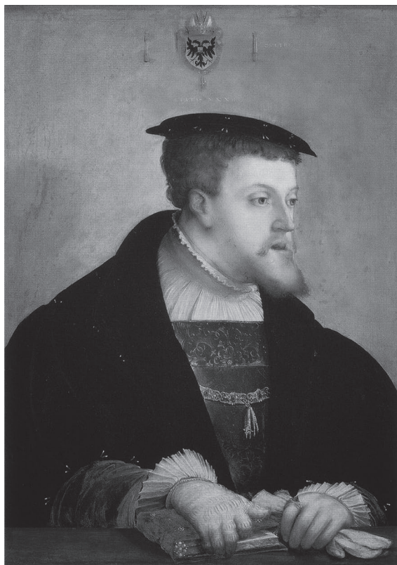
Imagen 2. Cristoph Amberger. Retrato de Carlos V emperador del Sacro Imperio. c. 1532. Gemäldgalerie. Berlin.

Otras pruebas del artificio de la fotografía las proporciona Gubern en La Mirada Opulenta (1987). La principal prueba y de la cual se derivan las demás, es que la fotografía no es una simple duplicación fotoquímica o fotodigital -agregaríamos para épocas más recientes- de nuestra percepción óptica, pues la cámara altera la representación en relación con la percepción binocular propia del ser humano.