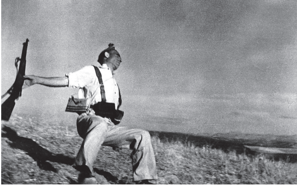
Imagen 3. Robert Capa. Muerte de un soldado. h. , 1936.

Para hablar de casos más recientes, con la fotografía digital surge la duda desde un inicio ya que, gracias a los fotomontajes y retoques digitales, no acreditamos que la mujer que vemos en una imagen publicitaria, por ejemplo, sea similar a la que se nos muestra.