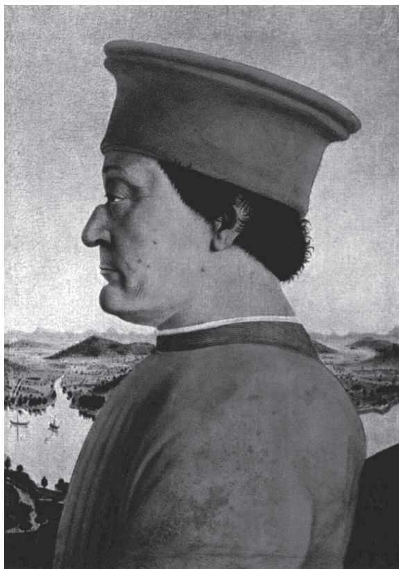
Imagen 1. Piero della Francesca. Federico II da Montefeltro . h.1465. Óleo sobre tabla, 47 x 33 cm. Galería de los Uffizi.

En otros casos los “mentirosos” pueden ser los modelos. Viene a nuestra mente una idea de Barthes que tiene que ver no tanto con mentir o posar sino más bien con la proyección de los deseos, anhelos y fantasías del ser: “ante el objetivo soy aquel que creo ser, aquel que quisiera que crean, aquel que el fotógrafo cree que soy, aquel de quien se sirve para exhibir su arte” (1994, p. 45). Burke menciona el caso del Duque Federico da Montefeltro en el siglo XV; él había perdido un ojo por lo que seguramente siempre era representado de perfil, quizá del lado que parecía digno de mostrar, posiblemente por elección propia o por decisión del autor del retrato.