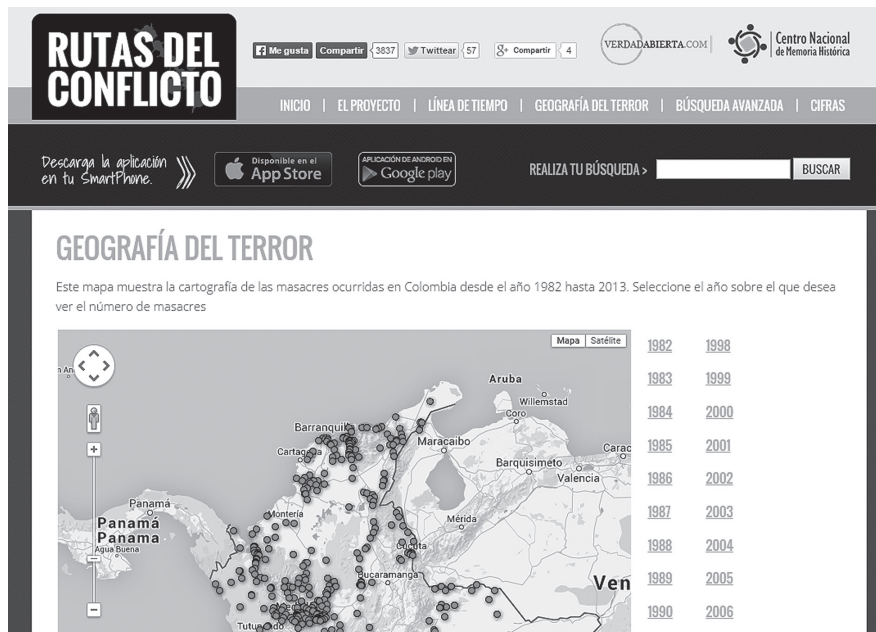
Imagen 5. Base de datos Rutas del Conflicto, realizada por el medio Verdad Abierta y el Centro de Memoria Histórica. http://rutasdelconflicto.com/