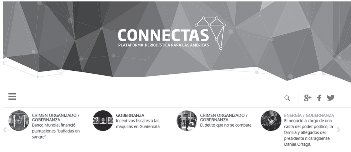
Imagen 1. Zona frontal superior de la página Connectas, Plataforma periodística de las Américas.

El tercer medio, también colombiano, es la Silla Vacía 6 , creado en 2009. El cuarto es Chequeado 7 , creado en 2010 en Argentina. El quinto medio es Connectas 8 , plataforma de periodismo para las Américas, fundado en 2012 desde Colombia. Finalmente, el sexto medio es Poderopedia 9 , fundado en 2012 en Chile.