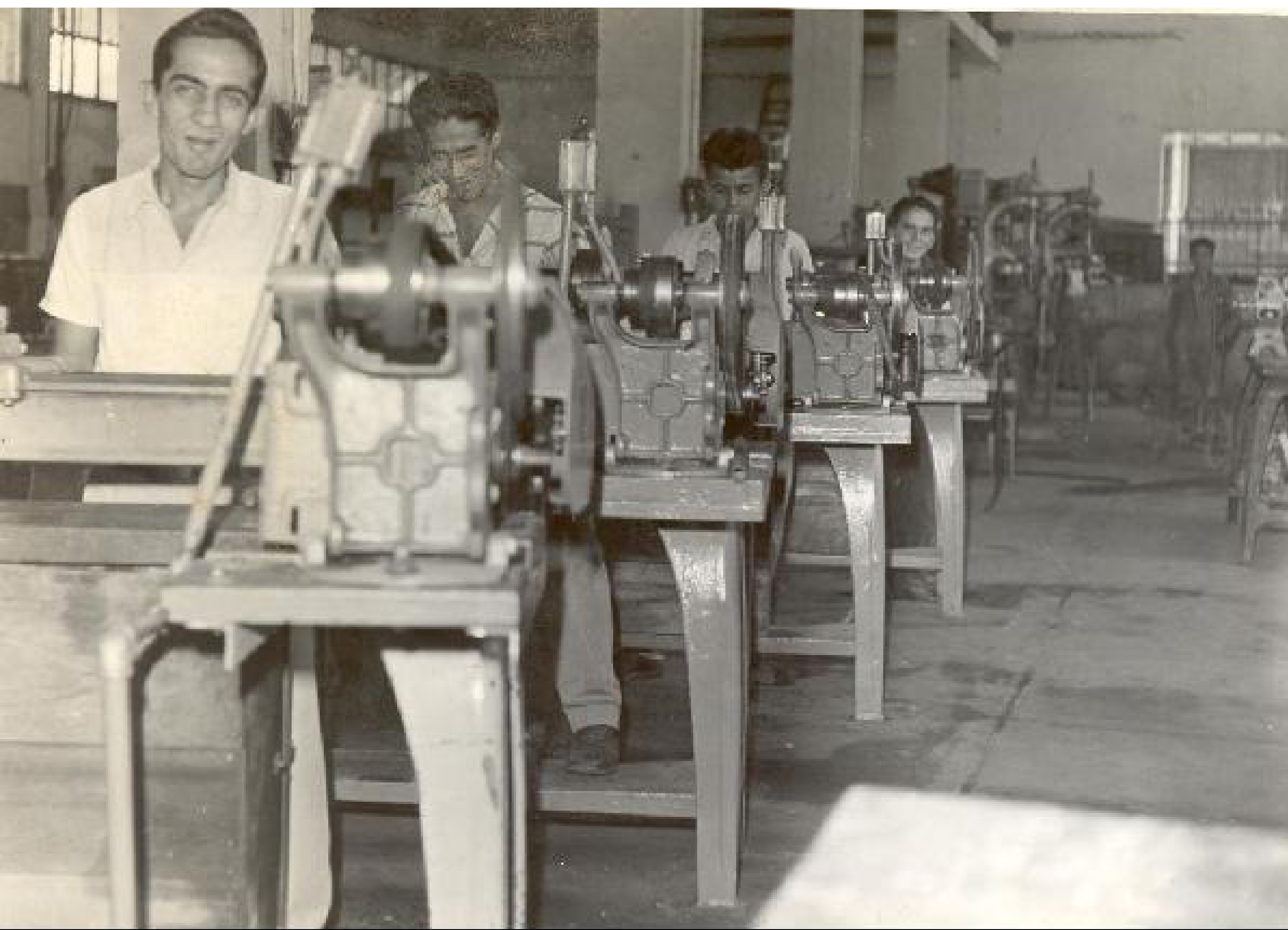
Figura 3. “Instituto Antonio José Camacho, taller de mecánica industrial. Antes Escuela de Artes y Oficios, creada por Acuerdo Municipal No 25 de 1933, que ordenó construir una escuela de formación técnico-práctica para dar respuesta a la necesidad de mano de obra capacitada, requerida por el crecimiento industrial y urbano de la ciudad. A partir de 1945 se le empezó a llamar Instituto Antonio José Camacho. Actualmente se conoce como Instituto Educativo Técnico Industrial Antonio José Camacho. Santiago de Cali, fecha aproximada, 1961.