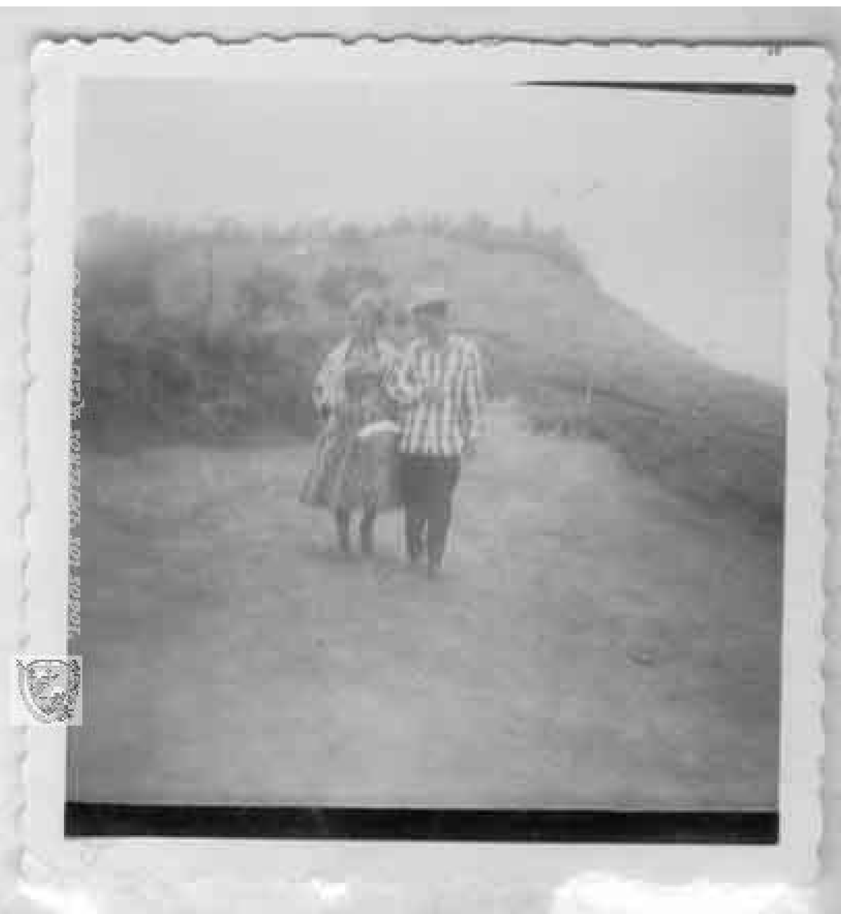
Figura 2. “Libardo Clavijo y Cecilia Betancourth. Paseo típico de los enamorados, paisaje propicio para el amor y el romance. El Águila 1958” (Archivo del Patrimonio Fotográfico y Fílmico del Valle del Cauca, 1958).