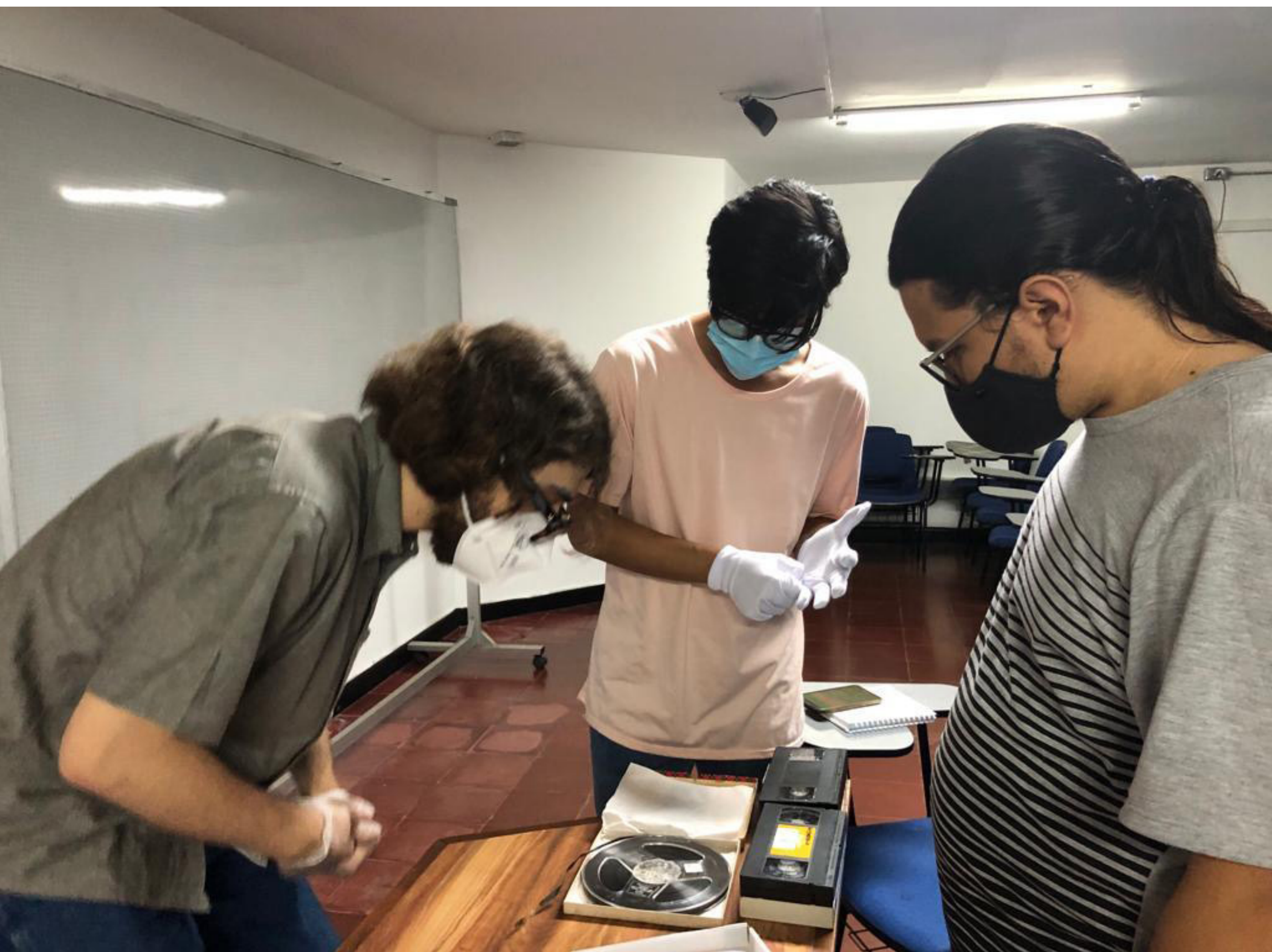
Figura 1. Encuentro con el equipo de Apex. Junio 5 de 2023. Escuela de Comunicación Social, Universidad del Valle.