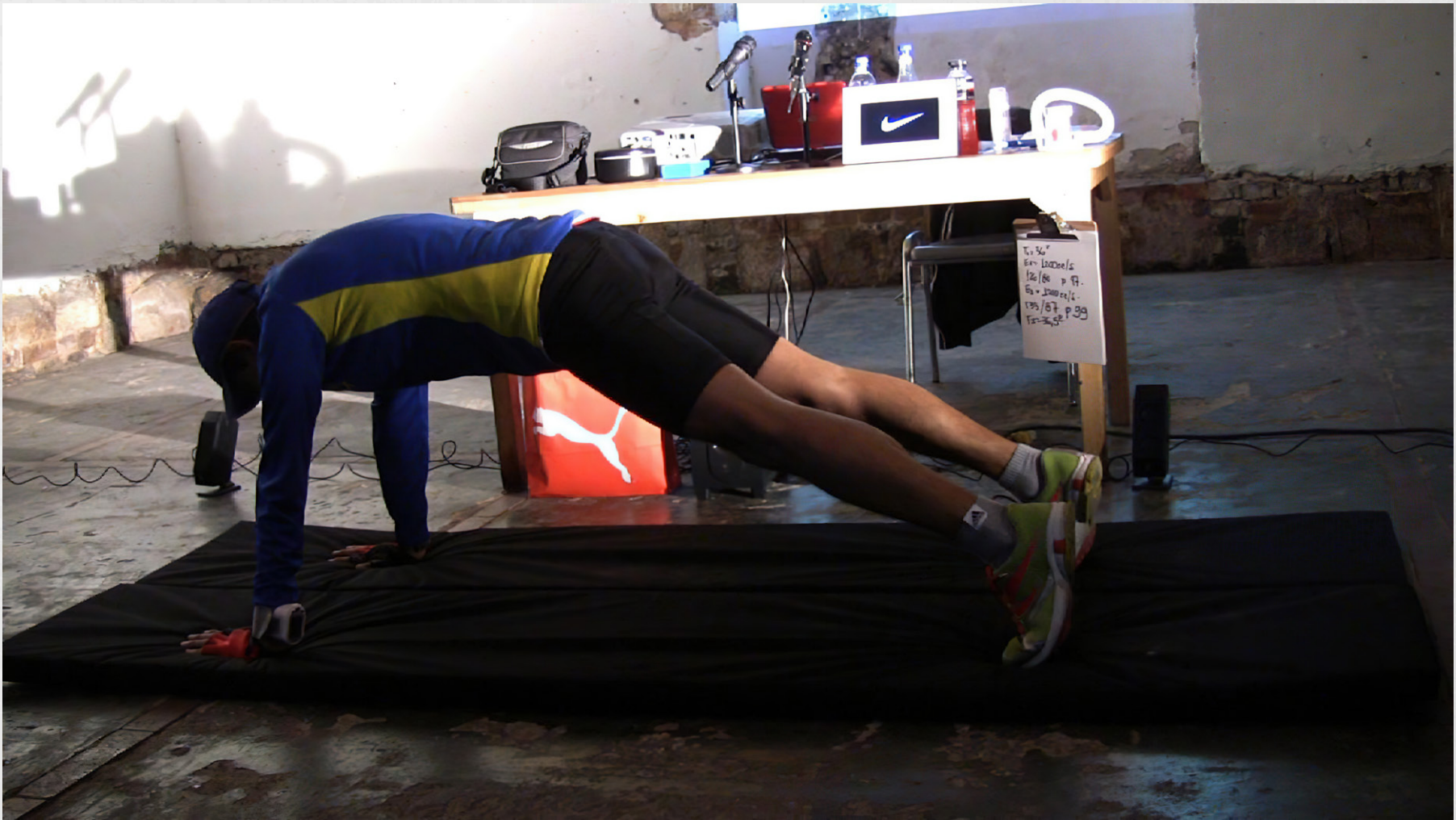
Cruzando la Línea. Ensayo #3 con vestuario #2. Entrenamiento.