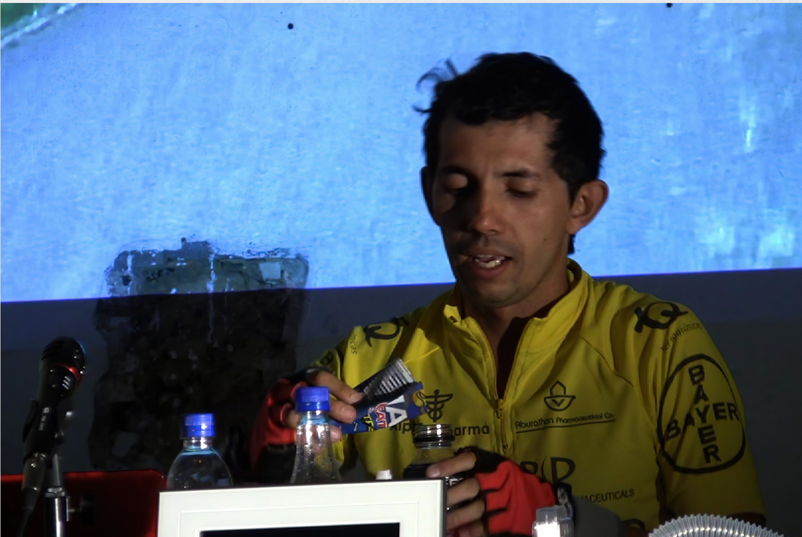
Cruzando la Línea. Ensayo #3. Mapa Teatro, Bogotá.