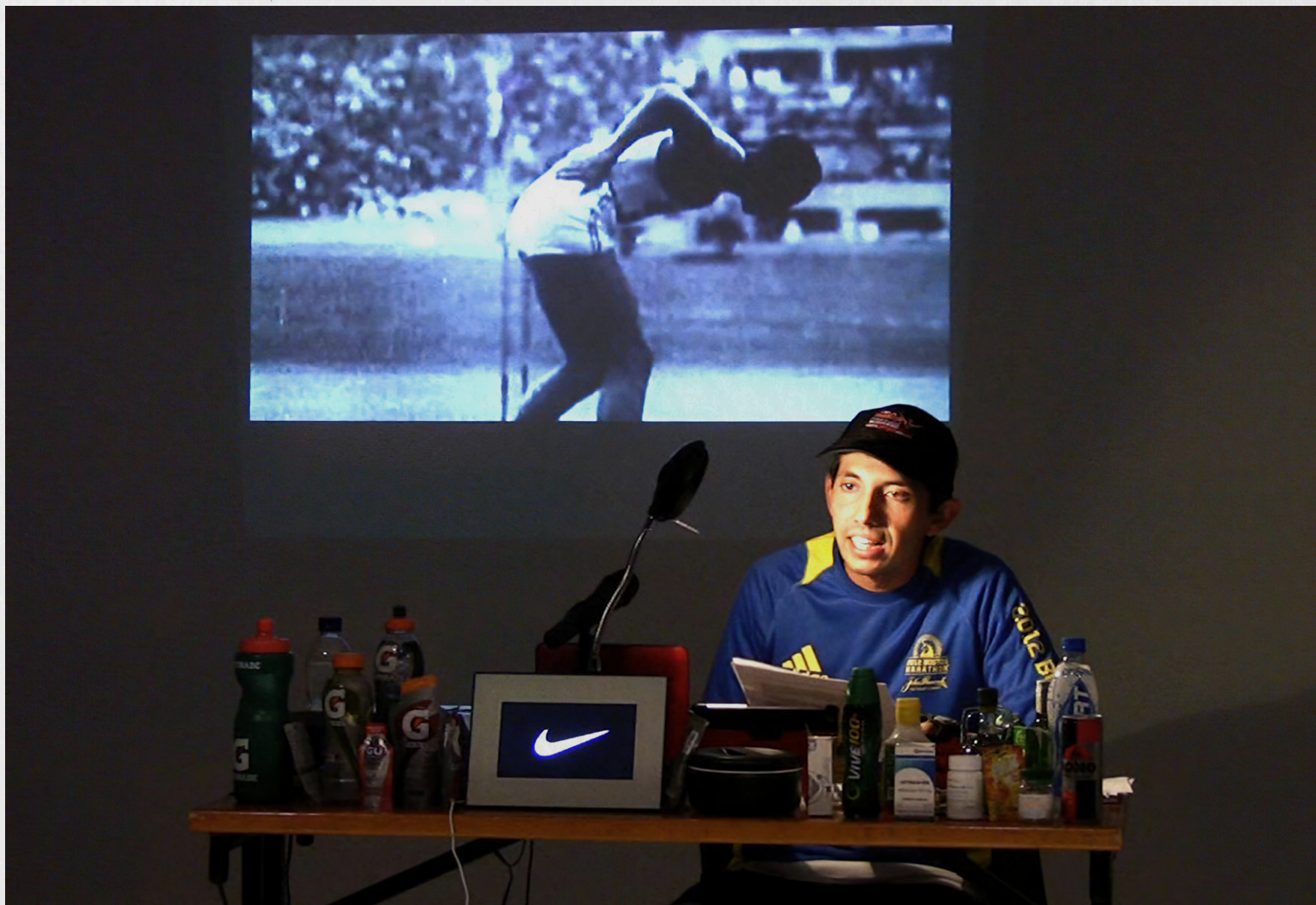
Cruzando la Línea. Performance. Museo de Artes UNAL, Bogotá. Agosto 2013.