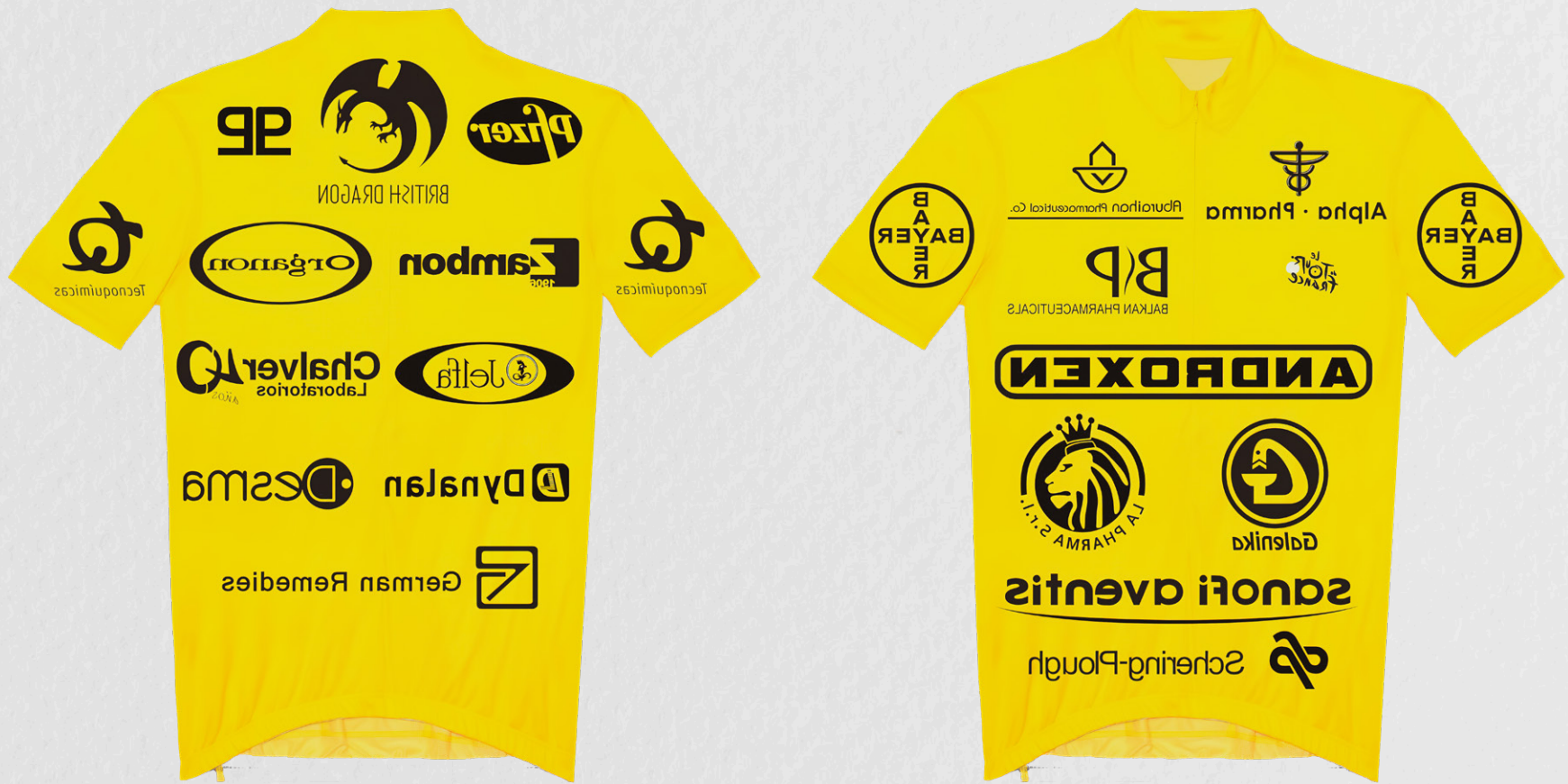
Cruzando la Línea. Vestuario para el cierre del performance.