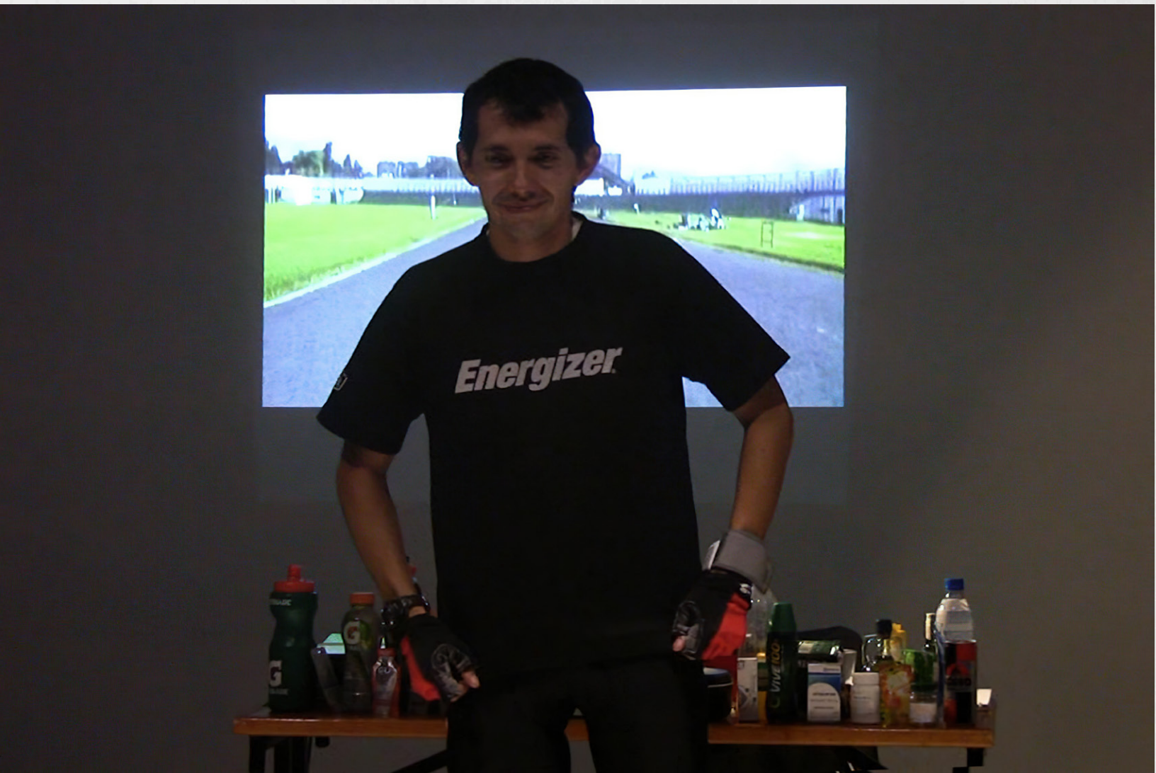
Cruzando la Línea. Cambio de camisetas y video de estadio UNAL.