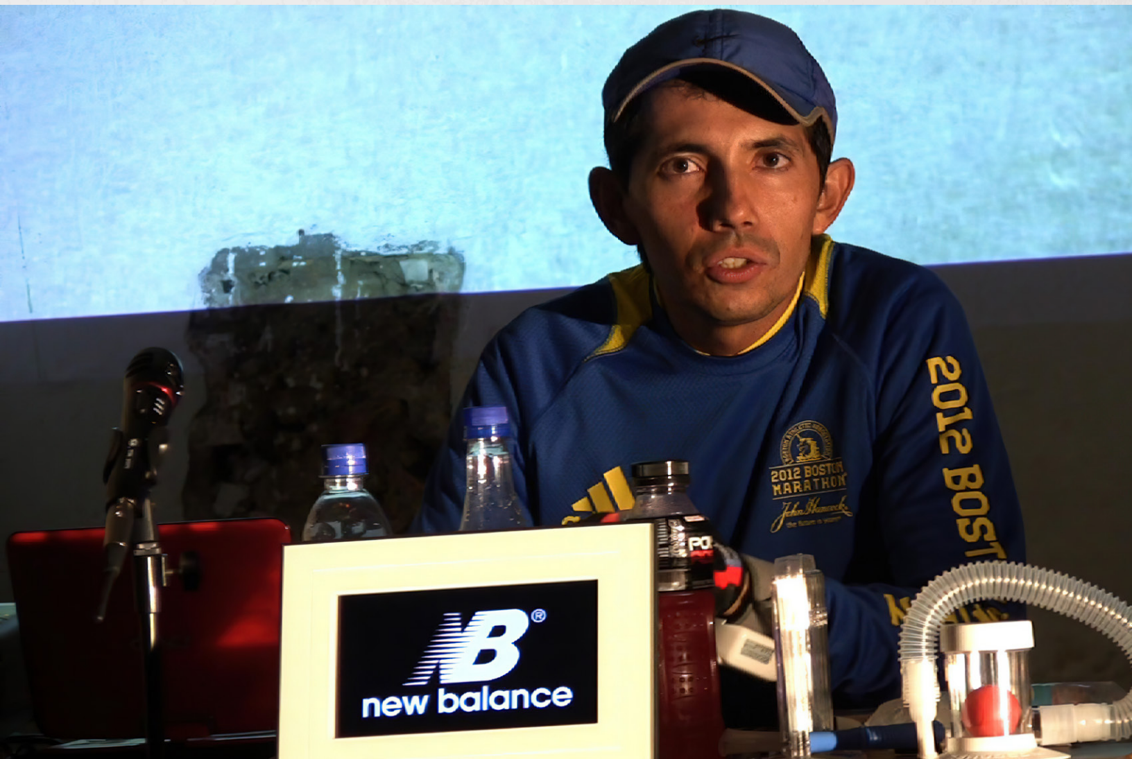
Cruzando la Línea. Ensayo #3, rueda de prensa.